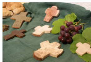
Kreuze aus Holz, Rinde, Leder

10-saitige Harfen (Davidsharfe) und 5-saitige Leiern